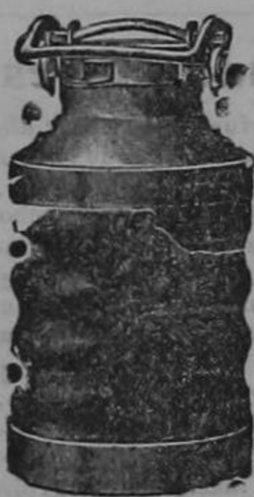
Almacenes al por mayor